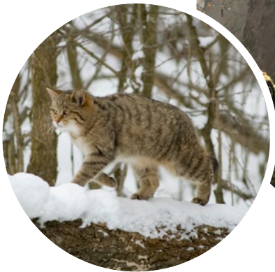
Wildkatzen gab es einst nahezu flächendeckend in deutschen Wäldern.

Die Wildkatze, Felis silvestris , breitet sich wieder aus. Elegant, anmutig und mit eigenem, wildem Charakter fasziniert uns dieser „kleine Tiger Deutschlands“. Die Wildkatze lebte schon in unseren Wäldern, lange bevor die Römer die ersten Hauskatzen über die Alpen brachten. Ihre Lebensräume sind naturnahe Laub- und Mischwälder. Diese Wälder müssen besonders geschützt und vernetzt werden, um die biologische Vielfalt zu erhalten.