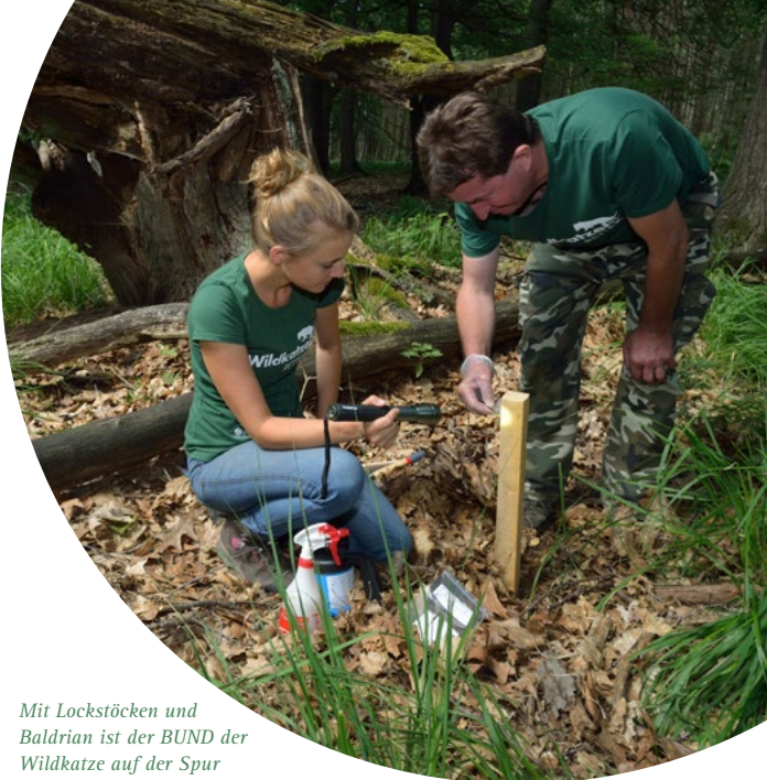
Mit Lockstöcken und Baldrian ist der BUND der Wildkatze auf der Spur