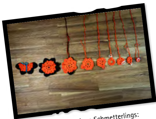
Größe des fertigen Schmetterlings: ca. 10 cm breit und 5 cm lang