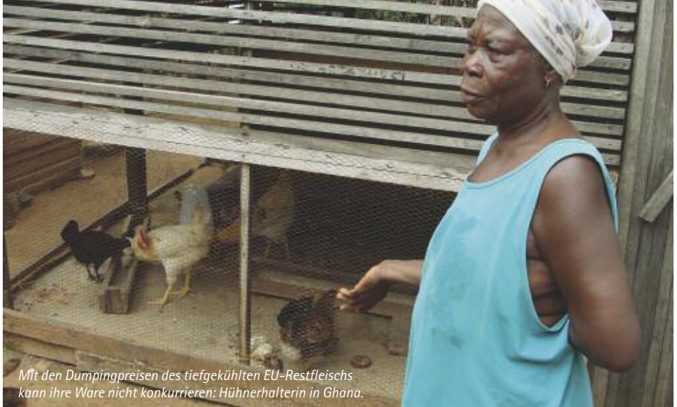
Mit den Dumpingpreisen des tiefgekühlten EU-Restfleisches kann ihre Ware nicht konkurrieren: Hühnerhalterin in Ghana.

Hühnerfabriken können die örtlichen Geflügelzüchter nicht mithalten. So kam in Ghana verzehrtes Geflügel 1992 noch zu 95 Prozent von heimischen Farmern, rund 20 Jahre später, 2013, waren es nur noch zehn