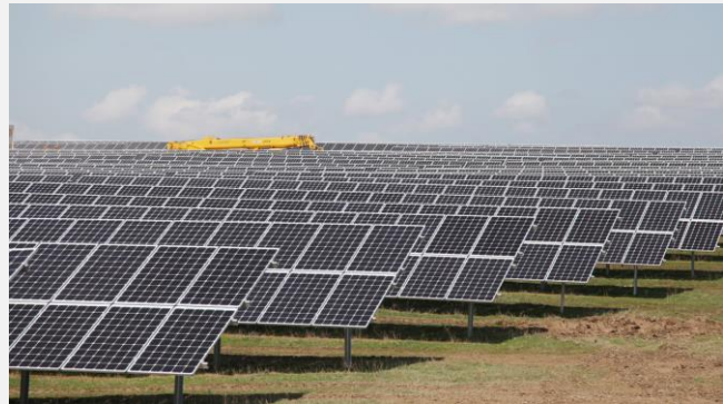
Abbildung 2: Solarkraftwerk Burnoye-1 in der Region Schambyl, Südkasachstan

Finanzierung: Kofinanzierung durch die Europäische Bank für Wiederaufbau und Entwicklung (EBRD) und andere multilaterale Entwicklungsbanken