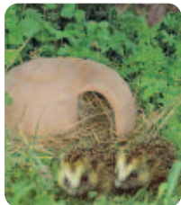
Igelschnecke Nr. 66 021 59,90 €