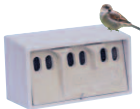
Reihenhaus für Spatzen Nr. 34 009 73,50 €