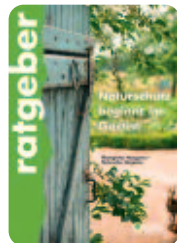
ratgeber „Naturschutz beginnt im Garten“ Nr. 09 006 8,90 €

BUND laden Schönes kaufen, Gutes tun! www.bundladen.de