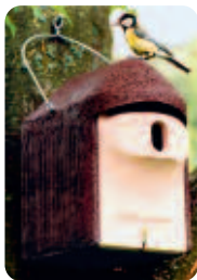
Nisthöhle 2GR mit Räuberschutz - oval Nr. 66 022 26,30 €