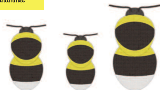
Drohn 13 bis 15 mm Arbeiterin 11 bis 16 mm Königin 13 bis 15 mm