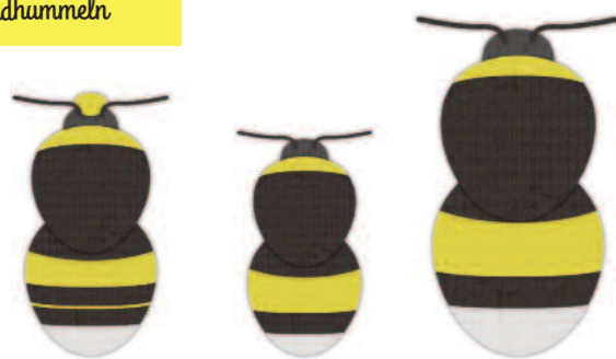
Drohn Arbeiterin Königin