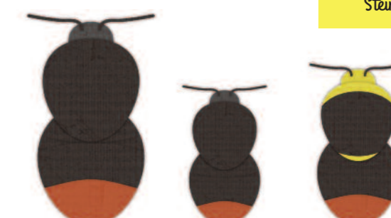
Königin 20 bis 22 mm Arbeiterin 14 bis 16 mm Drohn 14 bis 16 mm

Steinhummeln leben an Waldrändern, auf Wiesen, in Parkanlagen und Gärten. Sie besuchen am liebsten gelbe Blüten – auch auf dem Balkon.