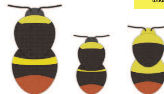
Königin 15 bis 17 mm Arbeiterin 14 mm Drohn 14 mm

Sie können Wiesenhummeln in lichten Wäldern, auf Wiesen, in Parks und Gärten beobachten.