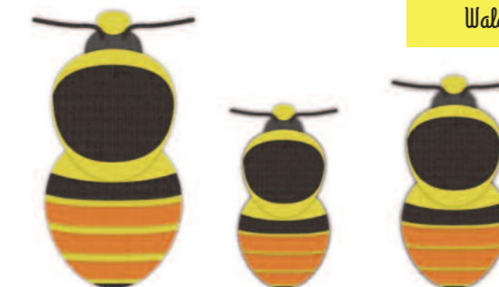
Königin 16 bis 18 mm Arbeiterin 10 bis 15 mm Drohn 12 bis 14 mm

Der Name „Waldhummel“ ist insofern irreführend, als sie gerade nicht im Wald lebt. Sie bewohnt Waldränder, parkartiges Terrain, einschließlich Gärten, Wiesen, Gräben und Böschungen.