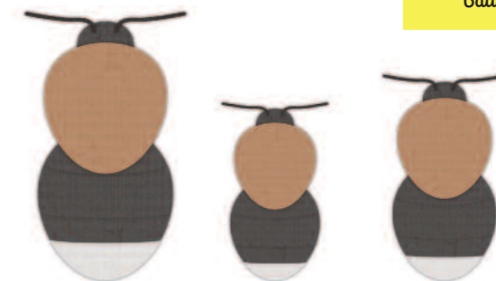
Königin 17 bis 20 mm Arbeiterin 8 bis 18 mm Drohn 14 bis 16 mm

Baumhummeln sind in lichten Wäldern, an Waldrändern, in Parkanlagen und in Gärten anzutreffen.