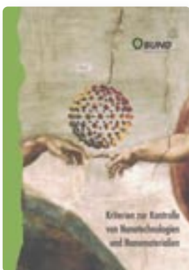
Broschüre Best. Nr. 55.042 K