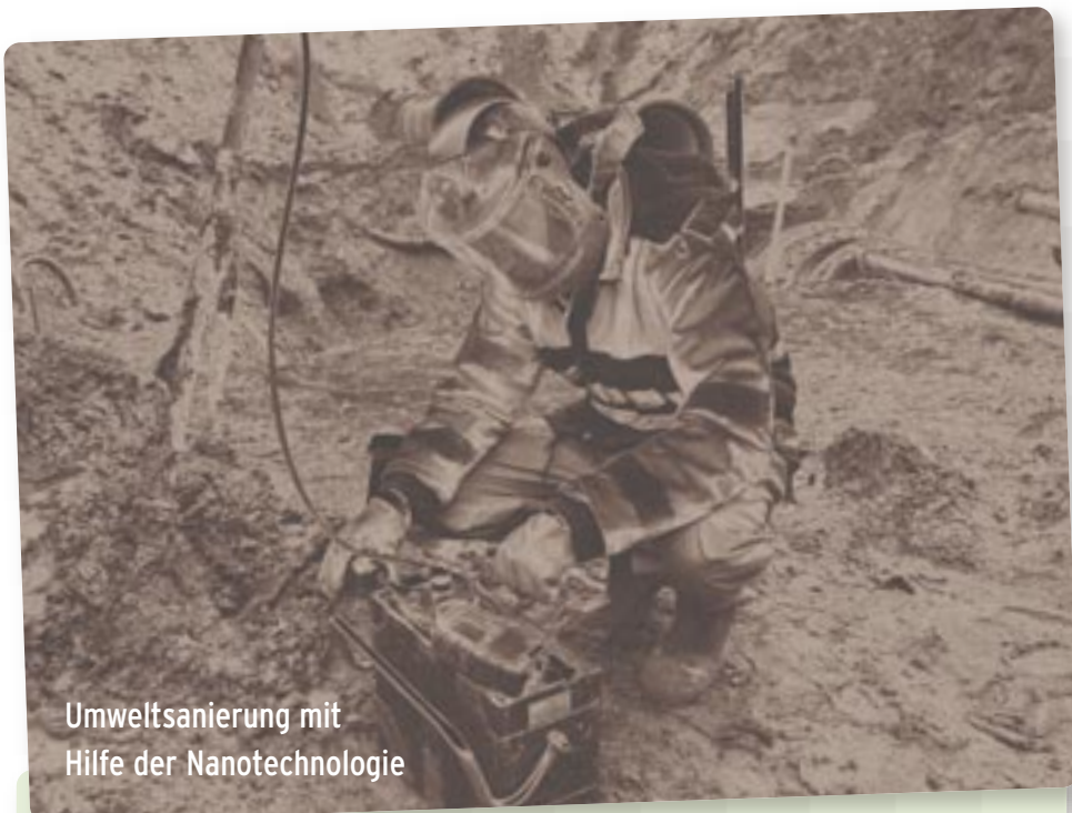
Umweltsanierung mit Hilfe der Nanotechnologie

Die Verschmutzung der Umwelt durch Schadstoffe und Abfälle stellt die Gesellschaft vor gewaltige Herausforderungen. Entsprechend wächst auch der Bedarf nach innovativen Lösungen. Der Nanotechnologie wird hierbei eine führende Rolle zugeschrieben. Die Lösungsansätze reichen von einer Reduktion der produzierten Abfälle und Schadstoffe, über die Entfernung dieser aus der Umwelt bis hin zur Wiederverwertung von Abfällen als wertvolle Ressource.