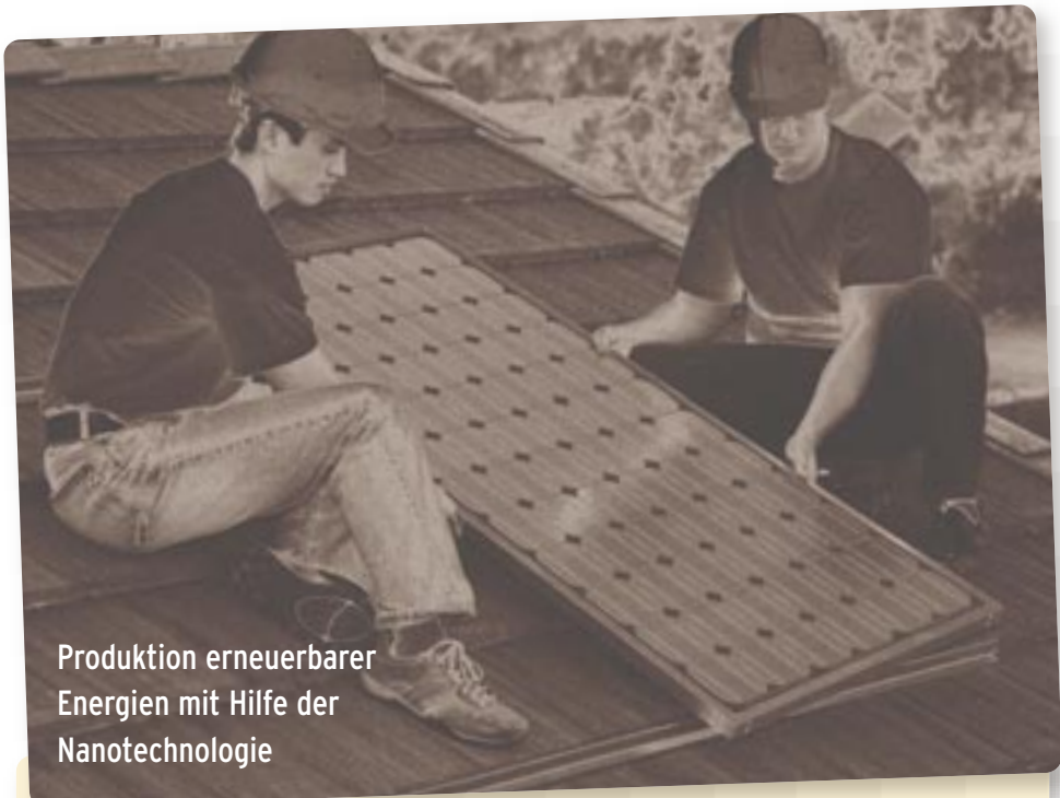
Produktion erneuerbarer Energien mit Hilfe der Nanotechnologie

Eine der größten Herausforderungen des 21. Jahrhunderts stellt der Übergang von fossilen Brennstoffen zu nachhaltigen, erneuerbaren Energiequellen dar. Der Klimawandel und das globale Ölfördermaximum (Peak Oil), werden es zwingend nötig machen, neue Lösungen zu finden – zumindest dann, wenn wir einige Elemente unseres Lebensstils beibehalten möchten. Der Nanotechnologie wird hierbei eine wesentliche Rolle bei der Suche nach technischen Lösungen für eine bessere Energieerzeugung, -speicherung und -verteilung zugesprochen.