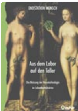
Broschüre Best. Nr. 55.036 K

WEITERE INFORMATIONEN FINDEN SIE IN UNSEREN PUBLIKATIONEN UND UNTER WWW.BUND.NET