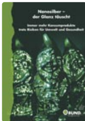
Broschüre Best. Nr. 55.053 K