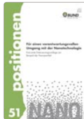
Broschüre Best. Nr. 11051