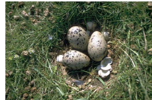
12 Nest vom Austernfischer

An der Nordseeküste gibt es das Wattenmeer, weil hier die Gezeiten wirken können. In der Ostsee dagegen kann nur ein starker und anhaltender Wind Windwattflächen verursachen, die vielen Vögeln Nahrung bieten. Die Ostsee ist ein Brackwassermeer, die Nordsee hat außer in Küstennähe einen Salzgehalt wie die großen Ozeane. Wegen des geringeren Salzgehalts und des stärker wirkenden Kontinentalklimas friert die Ostsee auch schneller zu als die Nordsee. Für viele Vogelarten bietet die Nordseeküste beständigere Verhältnisse und deshalb sind dort die Zahlen von Rast- und Zugvögeln höher als an den Küsten der Ostsee.