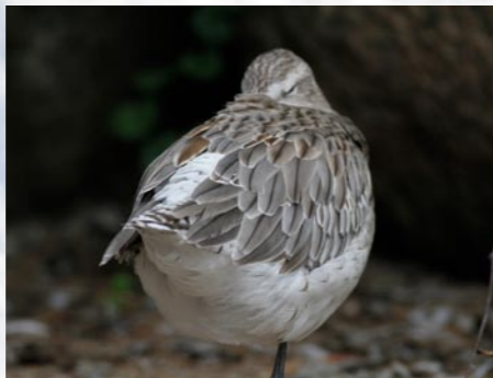
11 schlafende Pfulhschnepfe