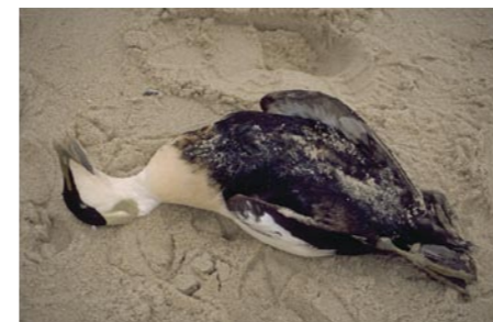
14 Tote Eiderente

Ölverschmierte Vögel sind nicht überlebensfähig, weil sie nicht mehr fliegen und tauchen können und außerdem Körperwärme verlieren. Bei dem Versuch, ihr Gefieder zu reinigen, nehmen sie Öl auf, was zur Vergiftung und zum Tode führt. Deshalb rettet auch das Einsammeln und Säubern von verölten Vögeln nur sehr wenigen vielleicht das Leben. Aber viel wichtiger ist, zu verhindern, dass Rohöl und daraus gewonnene Produkte überhaupt in die Meere gelangen. Denn nicht nur bei großen Katastrophen wie Unglücken auf Bohrinseln oder leck geschlagenen Schiffen fließt Öl ins Meer. Jeden Tag wird illegal Altöl von Schiffen in die Meere geleitet, um die Kosten für eine umweltgerechte Entsorgung an Land zu vermeiden.