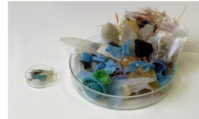
15 Plastikmüll, links im Bild Mageninhalt eines toten Eissturmvogels, rechts vergleichbare Menge für einen Menschenmagen

Auch der Plastikmüll in den Meeren ist eine große Gefahr für Vögel. Ob ein Tier sich in Resten von Fischernetzen verheddert und dadurch stirbt, oder ob es treibenden Plastikmüll für Nahrung hält und schluckt, bis der Magen irgendwann voll ist. Plastik in den Meeren wirkt auf verschiedene Arten tödlich.