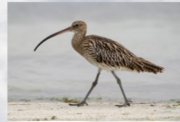
8 Großer Brachvogel