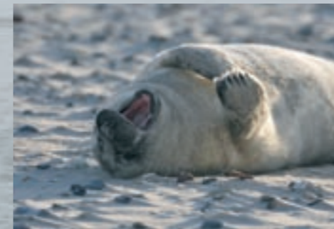
4 Junge Kegelrobbe

Kegelrobbenbabies kommen im Winter zur Welt, Seehunde werden im Sommer geboren. Trotzdem brauchen beide eine dicke Speckschicht, um im Wasser nicht auszukühlen. Die Milch der Muttertiere hat ca. 50% Fettanteil, damit kann ein Jungtier schnell Gewicht gewinnen. Auch für den Zeitraum, in dem sie lernen, selbst erfolgreich zu jagen, brauchen sie eine Reserve. Neugeborene Schweinswale werden ebenfalls gesäugt. Das erledigen Mutter und Kalb allerdings unter Wasser und nicht wie Seehunde und Kegelrobben auf der Sandbank oder am Strand.