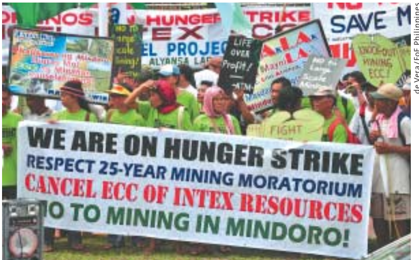
de Vera/FoE Philippines

November 2009, Insel Mindoro: Protest vor der Umweltbehörde, die dem norwegischen Konzern Intex den Abbau von Nickel erlaubte.