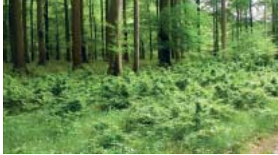
Offenbarungseid für die Nationalparkverwaltung: Im Unterwuchs prägen Bonsai-Buchen das Bild.