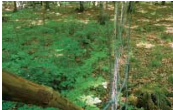
Bewuchs diesseits und jenseits des Gatters: mehr Waldweide als Nationalpark.

Dem Land Mecklenburg-Vorpommern ist also nicht nur die chronische Unterfinanzierung des Kleinods auf Rügen anzulasten. Es sieht auch seit Jahren tatenlos zu, wie der Ruf beider Nationalparke national und international Schaden nimmt. Im August geht der jetzige Parkleiter in Pension. Der BUND fordert Umweltminister Till Backhaus eindringlich dazu auf, für einen kompetenteren Nachfolger zu sorgen.