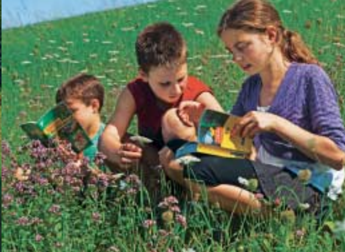
Welche Pflanzen und Tiere droht der geplante Steinbruch zu vernichten?

listet sie Punkt für Punkt auf. 145 Hektar Ackerland und Wiesen sollen verschwinden. In drei Schichten würde rund um die Uhr Zement hergestellt – die Energie dafür müsste verbrannter Müll liefern. 1250-mal pro Woche würden Lastwagen den Zement abtransportieren.