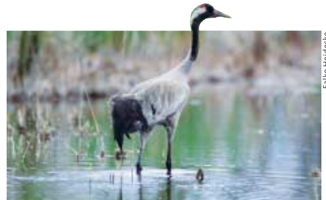
Einer der brütenden Kraniche in der BUND-Wildnis.