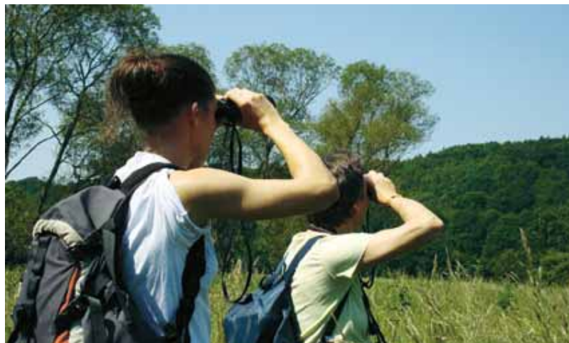
Schöne Aussichten: Am Grünen Band lässt sich viel entdecken.

Abgerundet wird der diesjährige Reisepavillon durch ein Rahmenprogramm mit Fachveranstaltungen,