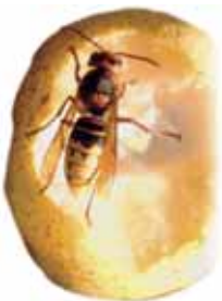
Hornisse nagt an einer Birne.

Die Spezialisten des BUND Darmstadt haben unter http://vorort.bund.net/darmstadt (Service) interessante Informationen über Wespen und Hornissen für Sie zusammengestellt. Auskünfte geben auch Naturschutzbehörden und -verbände vor Ort.