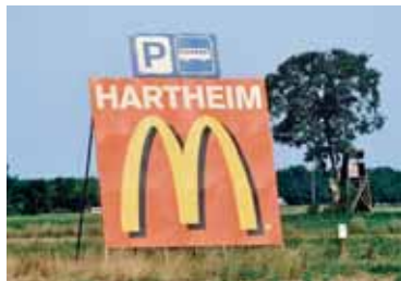
Werbetafel an der A5.

auch Sie mit Hinweis auf § 33 gegen Werbung in der Landschaft vor. Weitere Infos u.a. zu rechtlichen Fragen: www.bund-freiburg.de