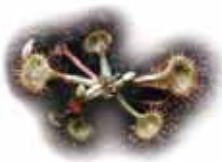
Bedrohter Moorbewohner Sonnentau.

Der BUND rät, für die Beete Kompost zu nehmen oder im Fachhandel torffreie Erde zu kaufen. Sie wird aus Holzfasern, Flachs, Rindenhumus oder Biokompost hergestellt. Kompost ist sehr nährstoffreich, künstlicher Dünger erübrigt sich. Er kann in Kompostwerken erworben, im eigenen Garten oder in einer Kiste auf dem Balkon selbst hergestellt werden.