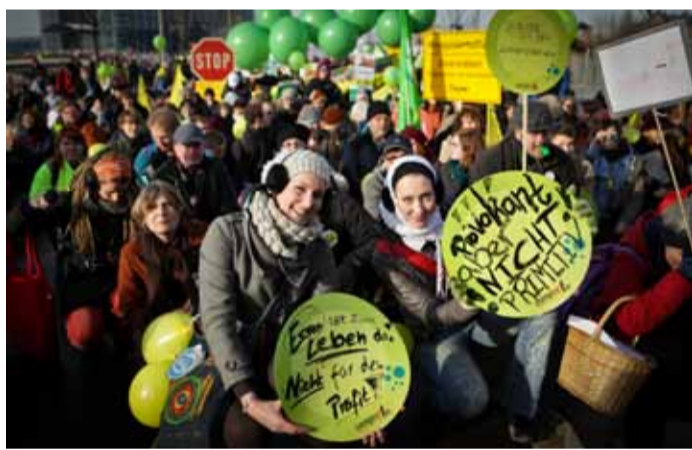
Erfolgreicher Auftakt der Kampagne »Meine Landwirtschaft« – die erste »Wir haben es satt!«-Demo vor einem Jahr.

Trotz des offiziellen Verbotes von Antibiotika in der Tiermast, werden 96% aller Hähnchen (in NRW) damit behandelt, werden Resistenzen gegen lebensrettende Medikamente gezüchtet. Europas Tierin-