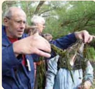
Der Wasserhahnenfuß wächst in der Ulster.

Doch nicht das ganze Tal soll Wildnis werden. Der überwiegende Teil der Wiesen soll er-