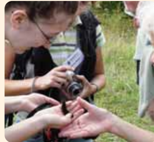
Vieles gab es zu entdecken - hier zum Beispiel eine Raupe.