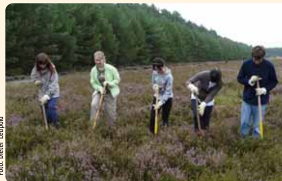
Jugendliche bei Pflegearbeiten am Grünen Band, nördlich von Arendsee.