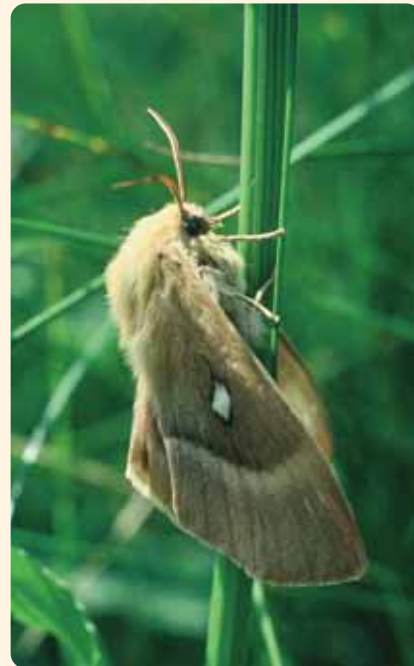
Das Männchen (li) ist deutlich dunkler gefärbt als das Weibchen (re). In stürmischem Zickzack fliegen die Männchen, während die Weibchen tagsüber meist versteckt am Boden bleiben. In ganz Mitteleuropa ist der Bestand rückläufig.