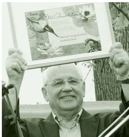
Michail Gorbatschow und sein Grüner Anteilsschein